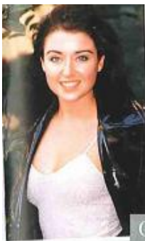
Sängerin DANNII MINOGUE, 39, steht zu ihrer Brust-OP: „Ich möchte so gut aussehen wie möglich“