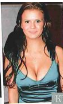
Ex-Atomic-Kitten-Star KERRY KATONA, 31, gefiel ihr großer Busen nicht mehr, sie ließ ihn verkleinern